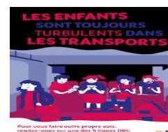
Il est conseillé de réserver à l'avance pour garantir la place de votre enfant. Merci de contacter l'OBC au 02 97 30 10 00.