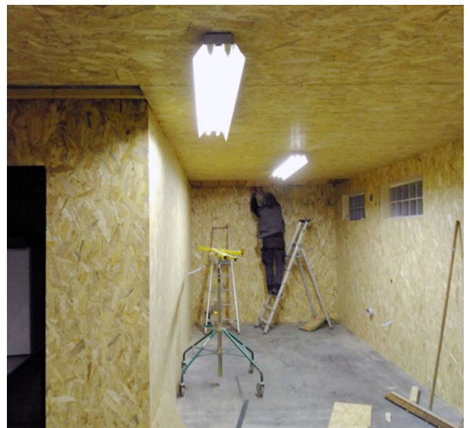
Rénovation du local technique communal